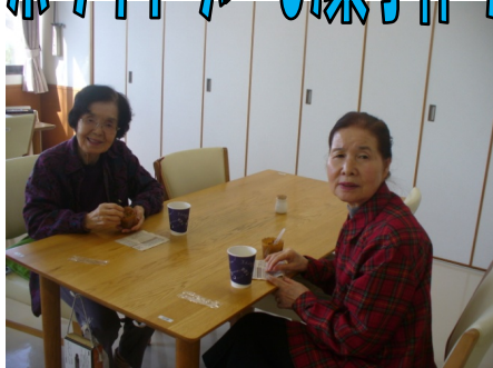
ホワイトデーお菓子作り

3月は慰問 (笑いヨガたかねクラブ)、ホワイトデーおかし作り、グルメ会 (西海橋) 大相撲クイズがありました。ベイサイド大村の桜も綺麗でしたよ!!