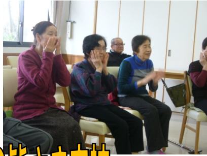
笑いヨガ (たかねクラブ) の皆さま来訪