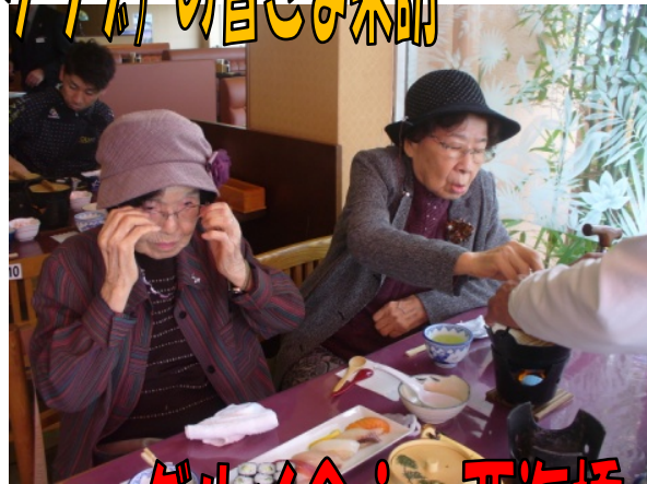
グルメ会 in 西海橋